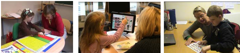
Bileta viser ulike elevar som kommuniserer med sine kommunikasjonsformer

Det finnast fleire metodar og/eller hjelpemiddel som kan nyttast dersom talespråket er fråverande eller mangelfullt. Personar som brukar ASK uttrykker seg med til dømes bruk av kroppsspråk, handteikn, grafisk ordforråd i kommunikasjonsbøker og talemaskiner eller bliss. Dette er språkformer som skal fungere som kompensierende, erstattande eller støttande for den manglande talespråket. Personens vanskar og ressursar dannar grunnlaget for kva slags metode eller hjelpemiddel han eller ho treng.